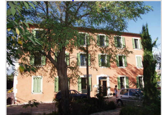
A LA BASTIDE DU BIEN ÊTRE